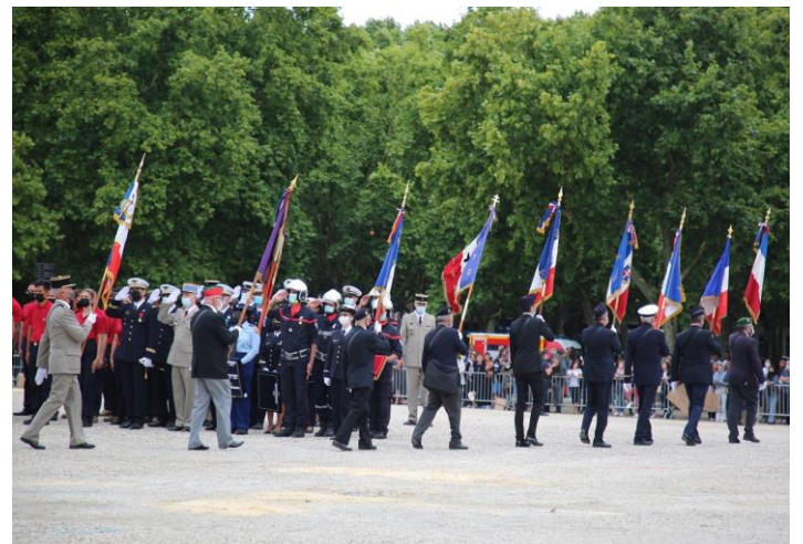
Défilé des porte-drapeaux pour clôturer la cérémonie.