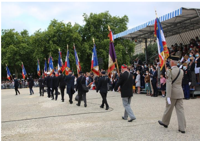
Mise en place pour le défilé.