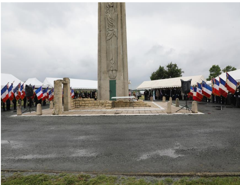
La cérémonie sous un ciel grisâtre.